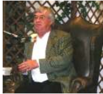
Peter Härtling las aus seinen Romanen „Die große, kleine Schwester“ und „Janek“.

Im Sommer fand in der Stuttgarter Stadtbibliothek Bad Cannstatt in Kooperation mit der Stabsstelle für europäische und internationale Zusammenarbeit der Stadt Stuttgart ein Abend mit Peter Härtling statt. Unter den Gästen auch die Vertreterin des Slowakischen Konsulats in Stuttgart.