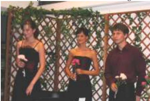
Studenten des Streichquartetts aus Brünn

Der Abend endet auf der sommerlich warmen Terasse mit einem Film über Brünn. Professionell und gut gemacht zeigt die Kamera alle die schönen und für Brünn typischen Stätten. Ein den Zuschauern nicht auffallender faux-pas bei dem Kameraschwenk über den Turm der Jakobskirche: Der Sprecher erläutert die im Mittelalter durch die deutsche Bevölkerung der Stadt erbaute und aufgesuchte Kirche als „die Kirche der einstmals in die Stadt gekommenen Kolonisten“.