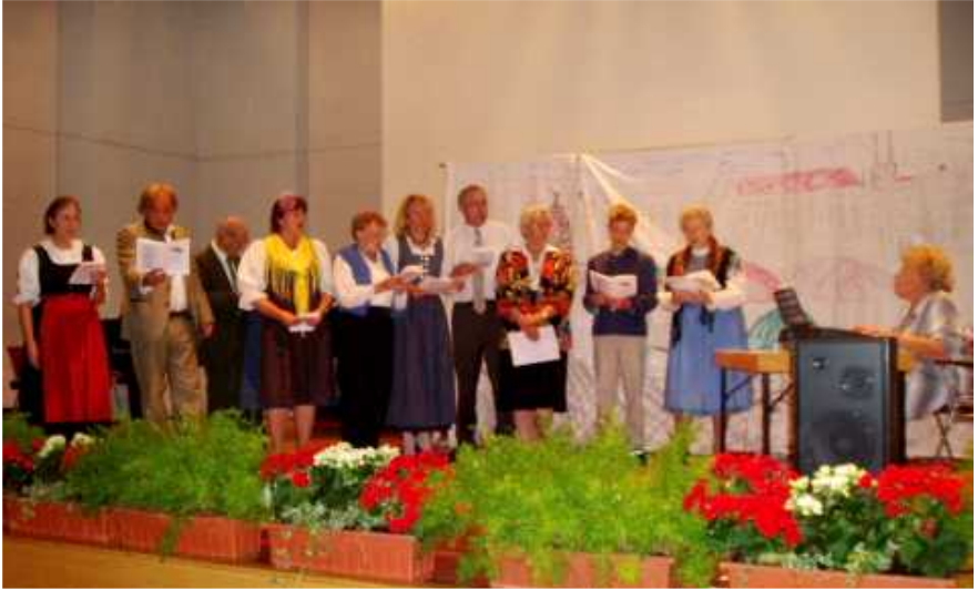
Die Brünner Deutsche Singgruppe die „Krautmarkt Singers“